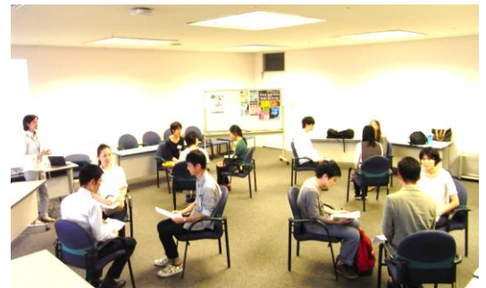
※過去の交流会のイメージ

参加予定の若手社会人（ゲスト）は… ・事務職/20代後半（産業用機械メーカー） ・事務職・技術職/20代後半・30代前半（IT）を予定。 その他、サービス業の方も参加予定！